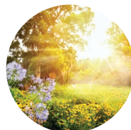
Parks & Gardens