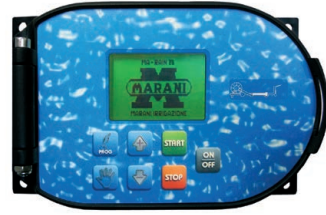
Computer Ma-Rain 26 kit c/w solar panel and pressure switch