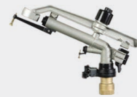
Hidra Part Circle