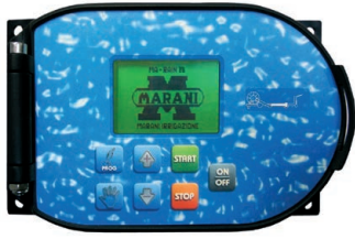
Computer Ma-Rain 26 kit c/w solar panel and pressure switch