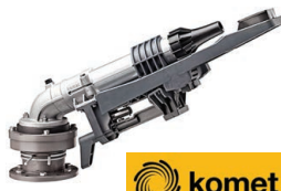
Komet 101 Ultra Kit