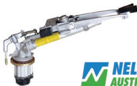
Nelson SR100 Gun