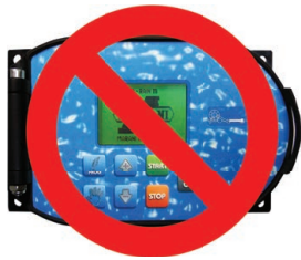
No on board computer