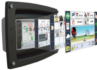
Ma-Rain 56 Kit