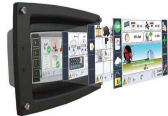
Ma-Rain 56 Kit