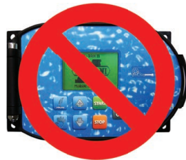
No on board computer