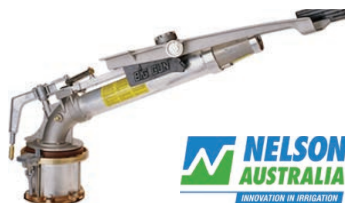
Nelson SR150 Gun