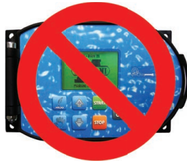
No on board computer