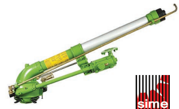
SIME Mariner 2 Speed