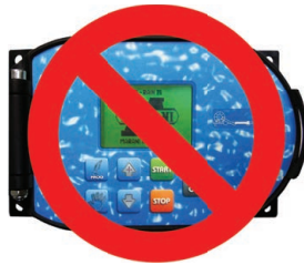
No on board computer