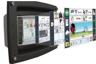
Ma-Rain 56 Kit