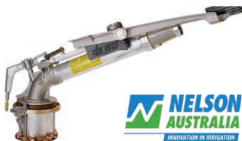
Nelson SR200 Gun