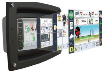
Ma-Rain 56 Kit