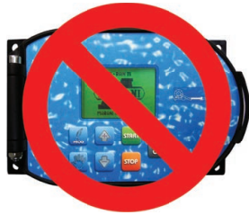
No on board computer