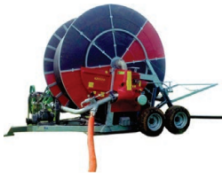
4 Wheel Chassis