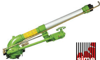
SIME Mariner 2 Speed