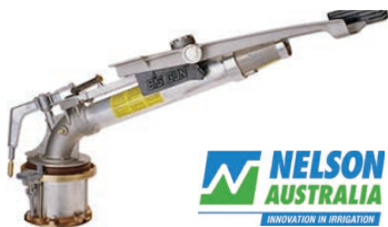
Nelson SR150 Gun