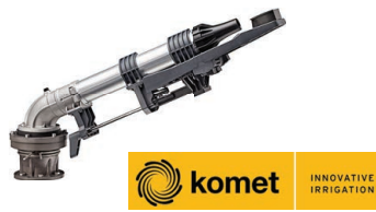
Komet 160 Ultra Kit