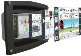
Ma-Rain 56 Kit