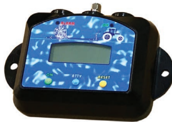
Wireless Measuring System for Ma-Rain 56 computer