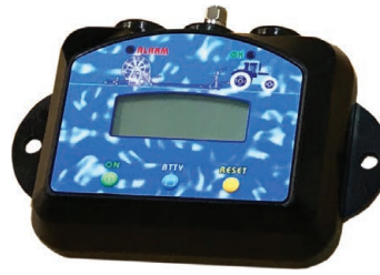
Wireless Measuring System for Ma-Rain 56 computer