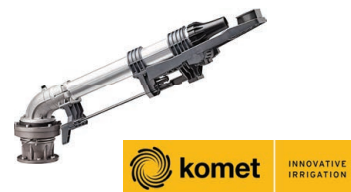
Komet 202 Ultra Kit