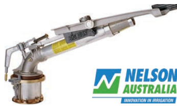
Nelson SR200 Gun