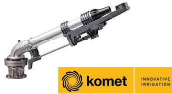
Komet 202 Ultra Kit