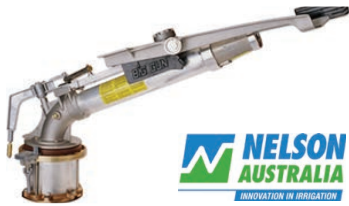
Nelson SR200 Gun