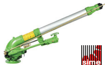
SIME Gemini 25° 2 Speed