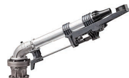
Komet 202 Ultra Kit