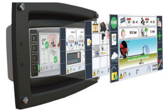
Ma-Rain 56 Kit