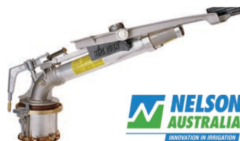
Nelson SR200 Gun