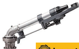
Komet 202 Ultra Kit