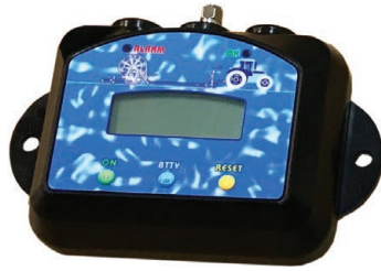
Wireless Measuring System for Ma-Rain 56 computer